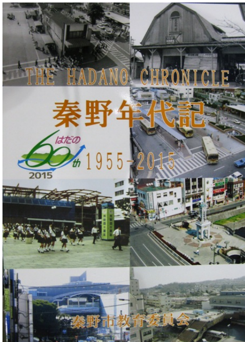
「秦野年代記 1955-2015」 (A4 カラー 32P)