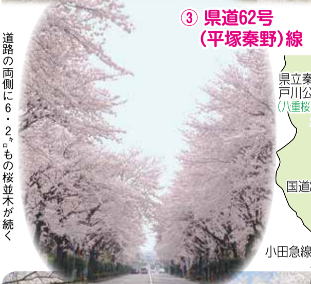
③ 県道62号 (平塚秦野)線