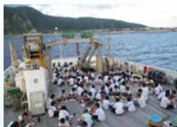
海風を感じながら食事

東海大学の海洋調査船「望星丸」で、中井・大井・松田・二宮町、清川村の中学生と海水浴