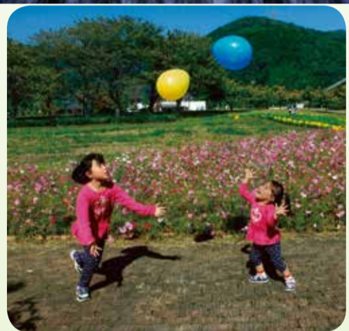
「秋桜の咲く頃」(26年10月掲載)

平成27年1月1日に迎える市制施行60周年を記念して、市が発行するカレンダーの掲載写真を募集します。四季折々の自然や地域の催しなど、あなたのお気に入りの風景でカレンダーを彩りませんか。