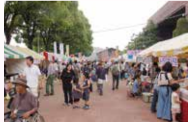
大勢の人でにぎわう