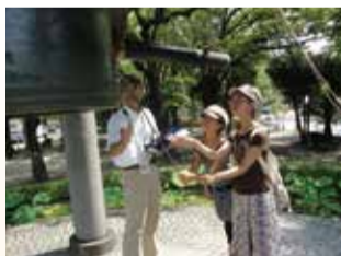
平和の鐘に祈りをささげる