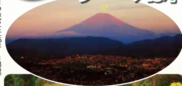
「満月の赤富士」(25年1月掲載)