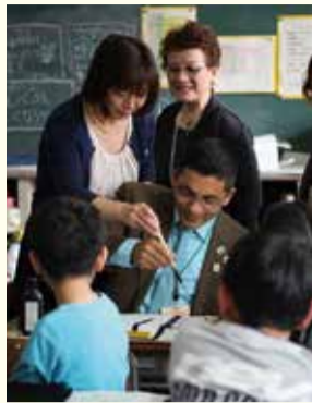
本町小学校で書道を体験

今年で姉妹都市提携50周年を迎える本市とアメリカ合衆国テキサス州パサデナ市。4月16日から21日まで、パサデナ市親善訪問団9人が、本市を訪れました。姉妹校である本町・西小学校、渋沢中学校を訪問したほか、丹沢まつりなどに参加して市民との交流を深めました。また、記念式典では、半世紀にわたる交流の歴史を振り返るとともに、次の50年への新たな幕開けを祝いました。