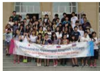
たくさんの仲間と国際交流