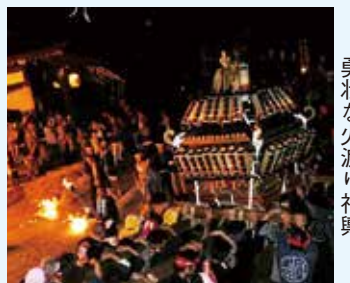
勇壮な火渡り神輿