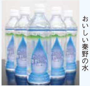
おいしい秦野の水

私たちの暮らしに欠かせない水。水資源の大切さを考えてみましょう。 水道水は安全です 安心してご利用ください 市の水道水は、定期的に水質検査を行っています。昨年度、市内全ての配水場で実施した測定の結果は、全ての基準項目が基準値以下の安全な数値でした。なお、放射性物質の測定結果や水質検査の結果は、市ホームページで公表しています。 災害時への備えを 大規模災害が発生し、配水管などの水道施設が被災したときは、復旧に時間がかかり、十分な対応ができないことが考えられます。家庭でも、日頃の備えをお願いします。 ◇清潔なポリ容器などに水を入れて保管し、定期的に入れ替えましょう ◇風呂の残り湯などをためておきましょう。トイレや洗濯などの生活用水として使えます ◇ペットボトルなどの飲料水を備蓄しておきましょう。市では、地下水から作った「おいしい秦野の水・丹沢の雫」を市内のコンビニエンスストアや飲食店などで販売しています。販売店は、市ホームページに掲載しています 📄水道業務課☎(83)2111