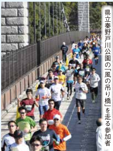
県立秦野戸川公園の「風の吊り橋」を走る参加者

申し込み 大会公式ホームページ( http://hadano-minase.jp/ )から申し込み ※郵便振替を希望するときは、専用の用紙(総合体育館、中央運動公園管理事務所、おおね公園、サンライフ鶴巻にあります)を使用してください