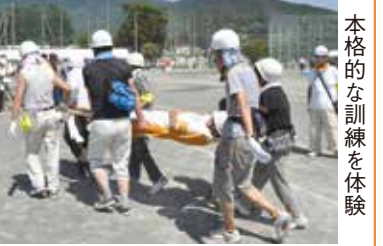
本格的な訓練を体験

午前9時に防災行政無線と緊急情報メールで、訓練開始をお知らせします。小・中学生も積極的に参加しましょう。 📅8月31日(日) 午前9時～正午 📄自治会避難場所、市内小・中学校などの広域避難場所 緊急情報メールに登録を 防災訓練の発災連絡のほか、火災、防犯、行方不明者の捜索などの情報を提供します。 登録方法 hadano@entry.mail-dpt.jpに空メールを送信し、返信されるメールに従って手続きをしてください 📄防災課☎(82)9621