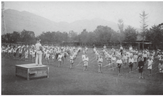
武道教練を受ける小学生