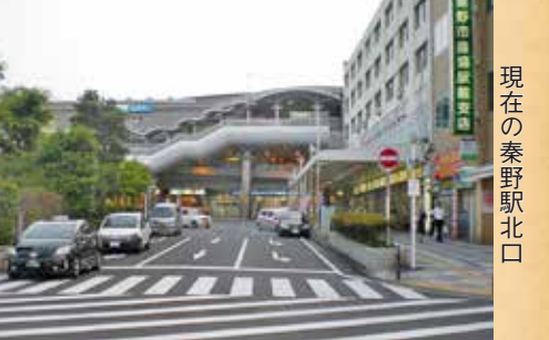
現在の秦野駅北口