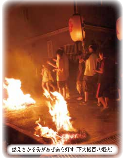
燃えさかる炎があぜ道を灯す(下大槻百八炬火)

精霊を迎え入れ、祈りをささげるために代々行われてきた盆の伝統行事。昔の人々の思いに心を寄せてみませんか。