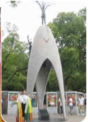
折り鶴ブースに囲まれた原爆の子の像

平和の日子供映画会 とき 8月9日(土) 午前10時～10時45分 午後3時半～4時15分 内容 「太陽をなくした日」・「二つの花」(アニメ) 定員 各回80人(当日先着順)