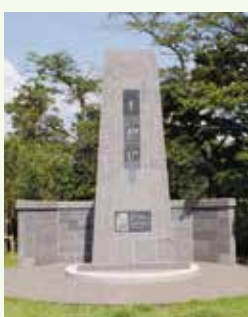
新しくなった平和塔

戦争の悲惨さと平和の尊さを語り継ぐため、昭和27年に権現山山頂に建てられた「平和塔・平和の礎」。老朽化が進み、汚れや傷みが目立っていたため、昨年12月に改修し、以前よりも分かりやすい場所に移設しました。平和の礎には、日清・日露戦争以降の戦争で亡くなった、秦野にゆかりのある約360人の名前が刻まれています。