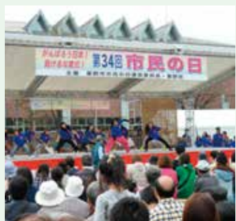
息の合ったパフォーマンス