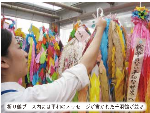
折り鶴ブース内には平和のメッセージが書かれた千羽鶴が並ぶ