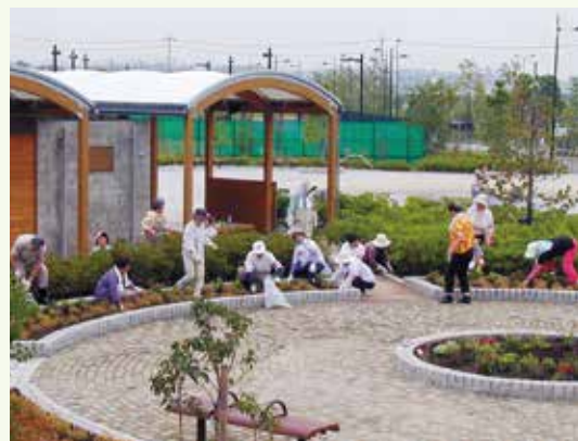
おおね公園の花壇を整備する里親