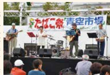
ステージを盛り上げよう