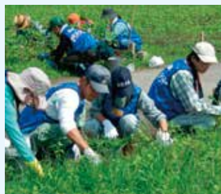
心を込めて支援活動