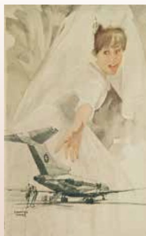
全日空ポスター「ジェットのハネムーン」