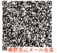
秦野里山メール会員

QRコードを読み込む、またはsinrin@city.hadano.kanagawa.jp宛てに、「里山メール登録希望」と題し、「氏名(必須)」「住所(任意)」「連絡先(任意)」を記載し、メールを送信してください。