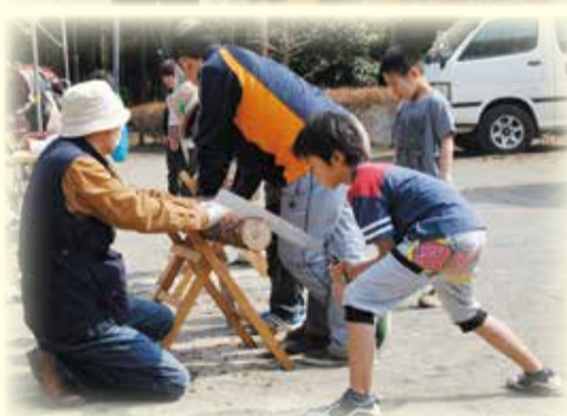
丸太切りに挑戦しよう