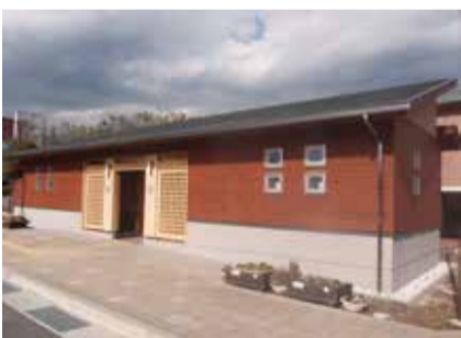
【中央運動公園のトイレ】秦野の木材を使ったトイレ。山小屋風の外観で秦野の景観にもマッチしています。

市では、「秦野市公共施設における秦野産材の利用の促進に関する基本方針」を策定し、公共建築の新設、改築などにおい