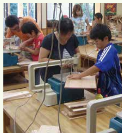
みんなで楽しく工作