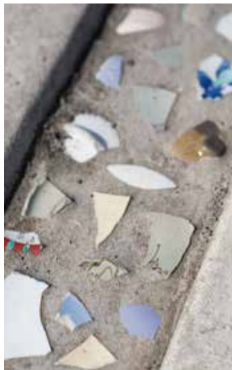
◀店の駐車場に「思い出の破片」を