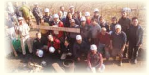
楽しく学び仲間もつくれます(上) チェーンソーでの実践研修(左)