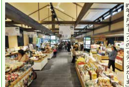
昨年4月オープン「セデッテかしま」

本市と災害時相互応援協定を結んでいるなど、交流が深い福島県南相馬市。常磐自動車道南相馬鹿島SAに隣接する「セデッテかしま」には、観光情報や特産品などが盛りだくさんです。 常磐自動車道全線開通1周年記念イベント とき 3月20日(日) 午前10時～午後2時 ※荒天中止 内容 郷土芸能の披露、白バイや雪氷車両の試乗など 問い合わせ 南相馬市観光交流課 ☎ 0244(24)5263