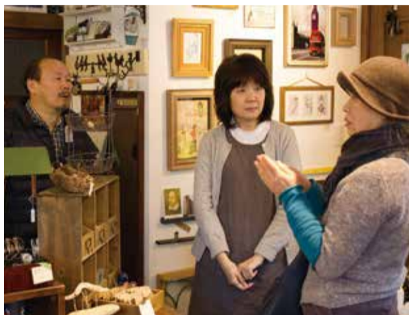
◀時には避難者同士で交流も