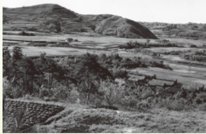
昭和30年代頃の里山風景

私たちにとって、ふるさとの原風景である里山にもう一度目を向け、守っていく必要があります。