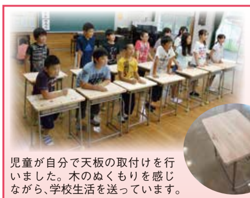
児童が自分で天板の取付けを行いました。木のぬくもりを感じながら、学校生活を送っています。

一枚一枚手作りで作られた机は、無垢材で手触りが良く、ヒノキの香りを感ずることが出来ます。児童が身近に木製製品の良さを体感し、木材利用の意義を学んでいます。