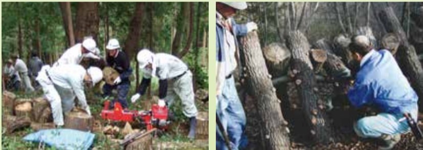
薪作りやシイタケの収穫も楽しめます

里山の保全活動を行うボランティアを募集しています。市内では、30を超えるボランティア団体が里山保全活動をしています。一緒に活動してもらえ仲間を募集しています。汗を流したい方、即戦力の経験者の方、初心者の方も大歓迎です。楽しみながら、森を育てる活動に参加してみませんか。ご興味のある方は、団体をご紹介しますので、森林づくり課へご連絡ください。