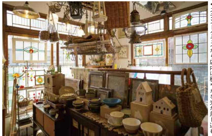
◀ステンドグラスから店内に穏やかな光が差し込む