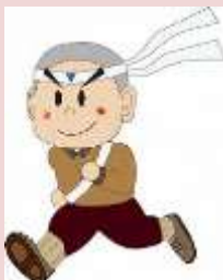
再配置推進キャラクター「丹沢つなぐ君」

この計画賞は、行政、民間を問わず優れた計画を発掘し、これを表彰することにより、社会全体の計画能力の向上を図る目的で、1995（平成 7）年に創設されました。