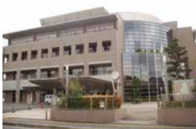
保健福祉センターのロビーに開局した郵便局

保健福祉センターのロビーのスペースを郵便局に賃貸し、施設の維持のための賃料収入を得るとともに、戸籍や住民票の写し等の証明書の交付事務を行う取組みを平成24年10月から開始しました。市民の皆さんに身近な場所で多くの手続きを行うことができるようになりました。