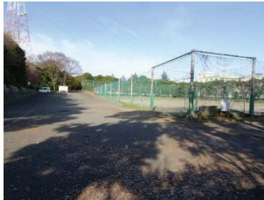
消えかけた駐車場ライン