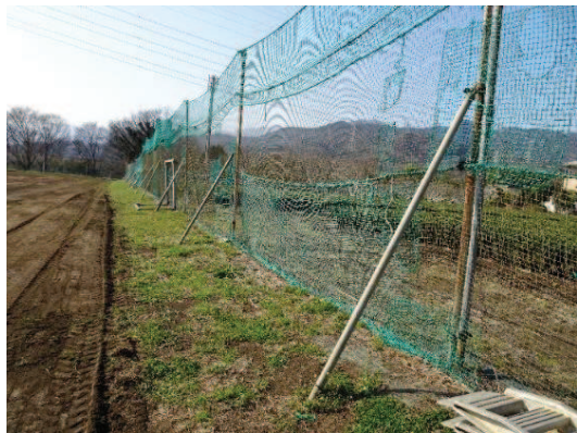
高さが不足している防球ネット