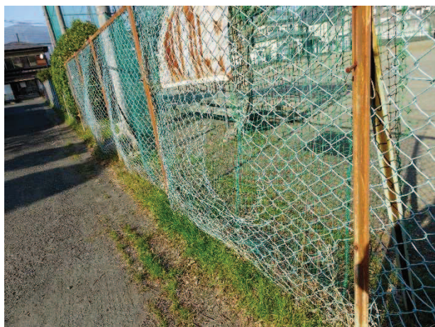
ネットフェンスの老朽化