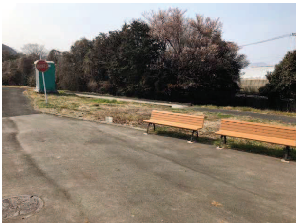
防球ネットがないため隣接の施設への被害が懸念される