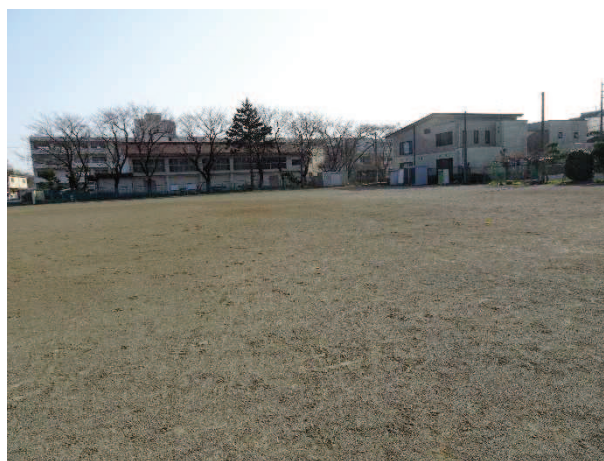
末広小学校側の防球ネットが未設置