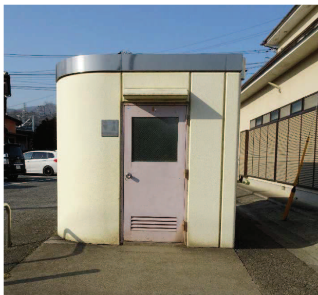
雨漏りのあるトイレ