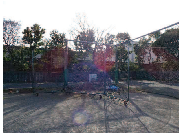
老朽化が進むバックネット