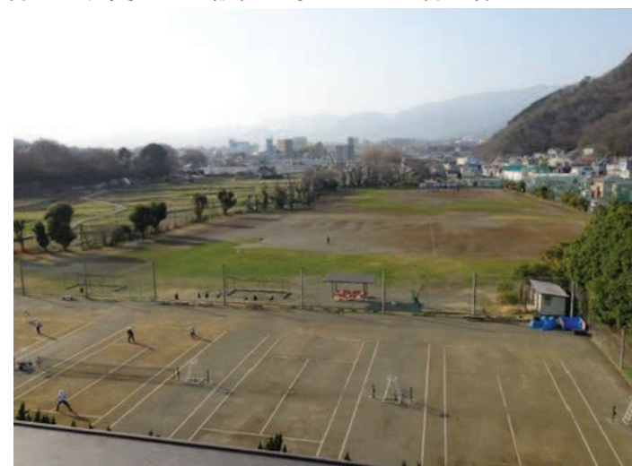
不陸整正が必要なグラウンドとテニスコート