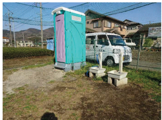
トイレと水飲み場