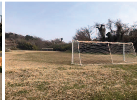
不陸整正が必要なグラウンド