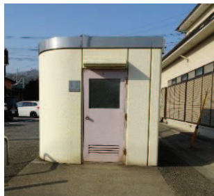
雨漏りのあるトイレ