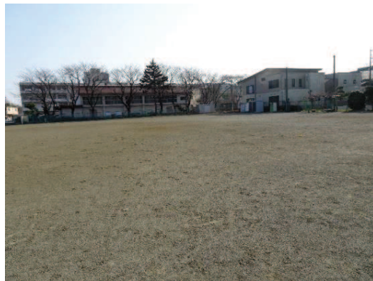
末広小学校側の防球ネットが未設置