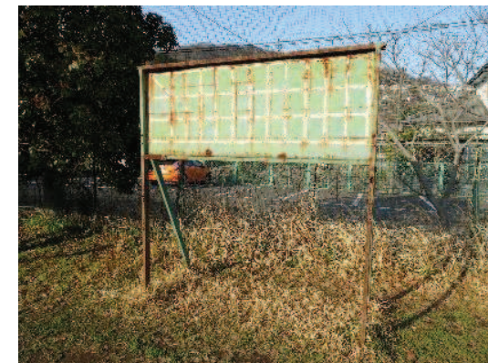
老朽化し、更衣室の設置が求められる管理棟とスコアボード