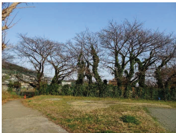
巨木となり、枝の落下も見られ、危険性の高い樹木