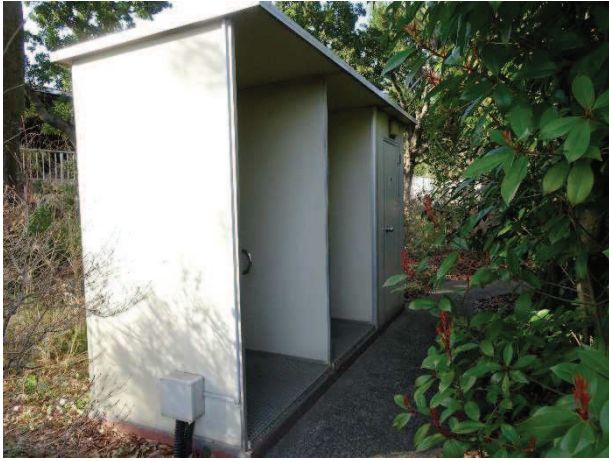
老朽化が進むトイレ