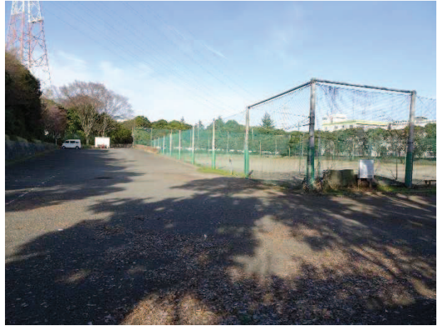
消えかけている駐車場ライン