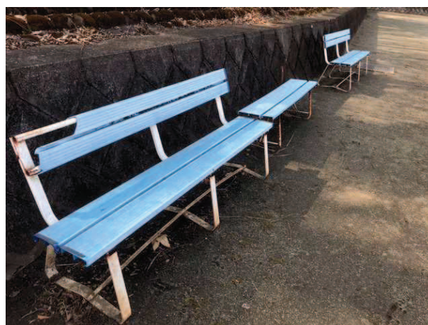
老朽化したベンチ