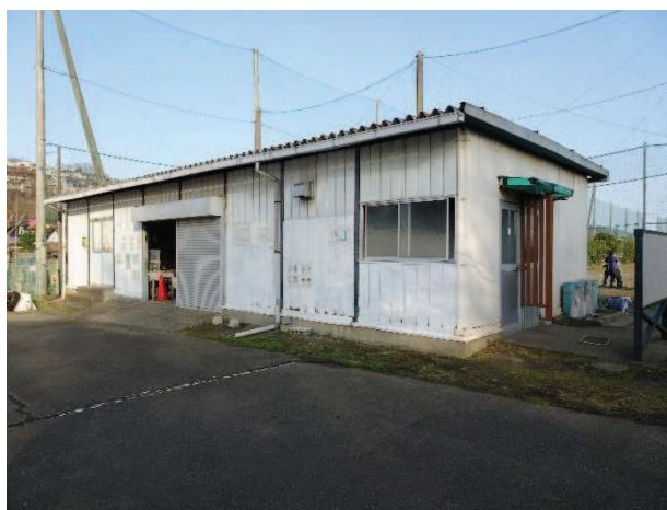
老朽化し、また、更衣室の設置が求められる管理棟