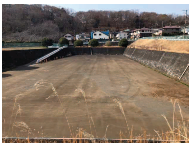
ラインが消えかけた駐車場