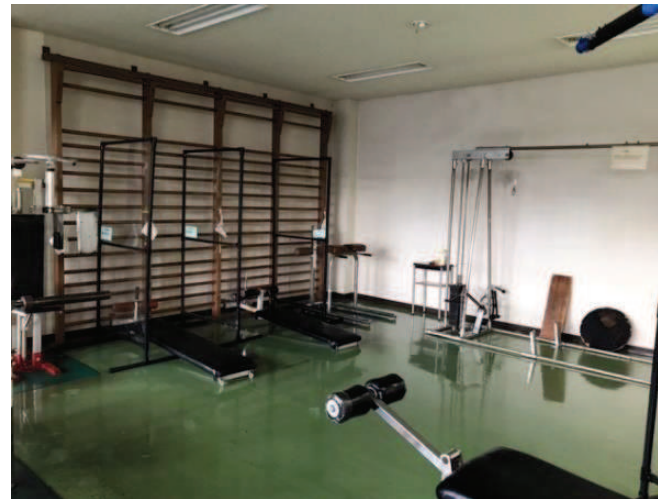
老朽化が進むトレーニング機器

課題への対応 令和6年度：トレーニングルーム改修等／820万円 令和7年度：カーテンレール交換工事／110万円