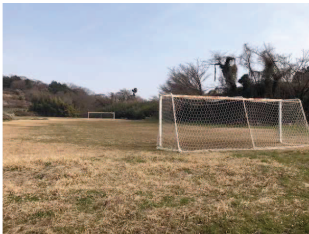
不陸整正が必要なグラウンド