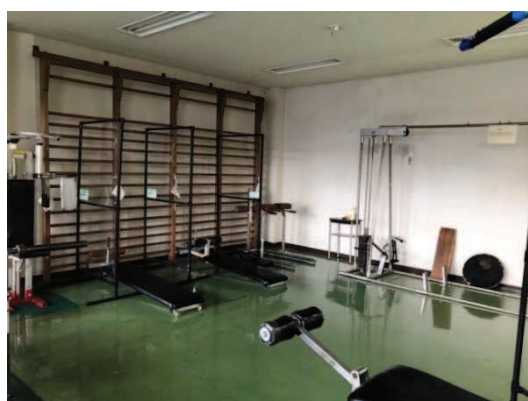
老朽化が進むトレーニング機器