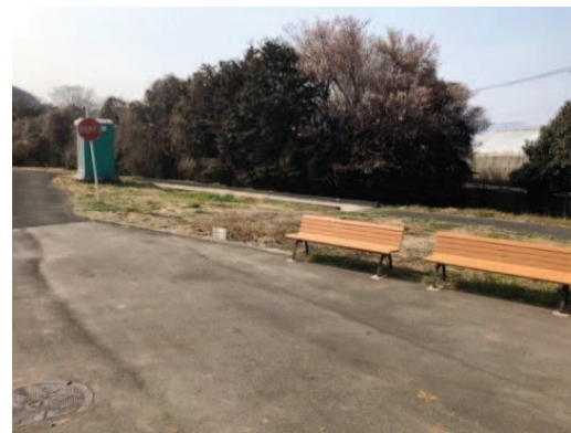
防球ネットがなく隣地被害の可能性有