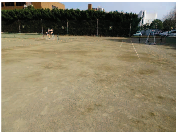
傾斜や凹凸等により競技に支障が生じているテニスコート