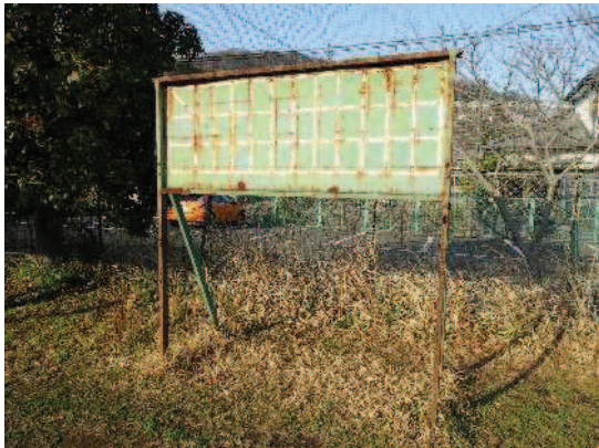
老朽化したスコアボード