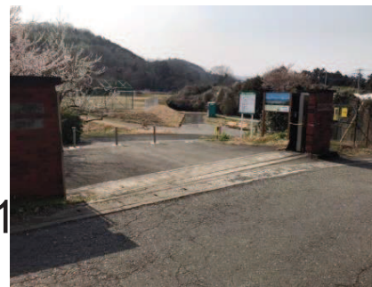
開放型へ転換し、ハイカー利用も増加している。