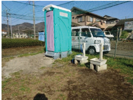
トイレと水飲み場