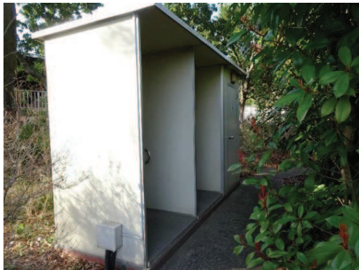
老朽化が進むトイレ

課題への対応 令和5年度：男子トイレ改修等／240万円 令和6年度：バックネット更新等／70万円