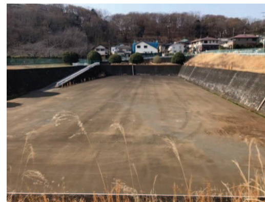
ラインが消えかけた駐車場

課題への対応 令和8年度：臨時駐車場ライン塗替等／40万円 令和9年度：ベンチ更新修繕等／10万円