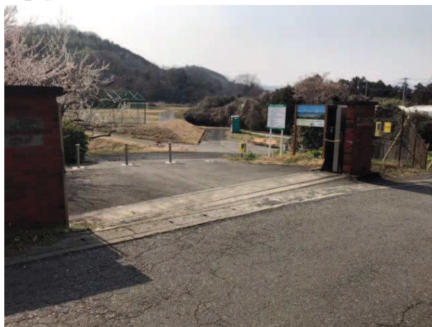
開放型への転換によりハイカーも立ち寄れる施設に