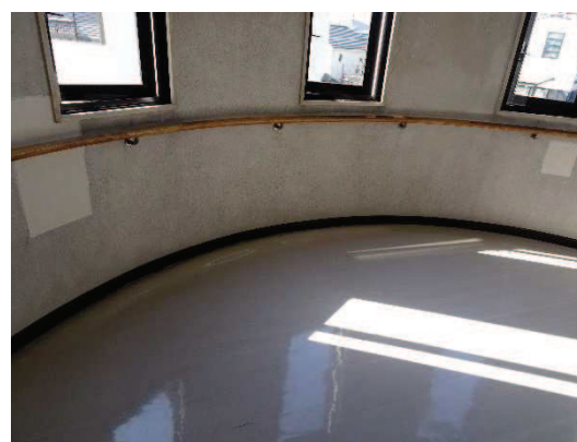
床の一部がたわむ階段踊り場