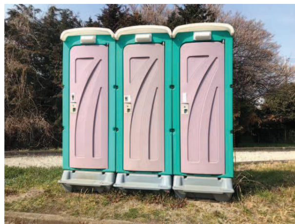
リース契約でトイレを設置