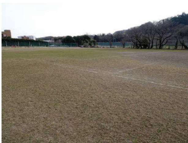
段差が生じ、子どもの利用への危険性の指摘があるグラウンド