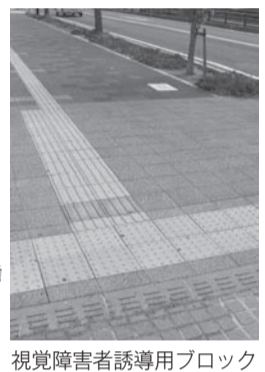
視覚障害者誘導用ブロック

答 小田急線4駅周辺は、秦野市交通バリアフリー基本構想に基づき設置を行っている。 要望 視覚障害者誘導用ブロックが設置されていない場所が多数見受けられることから、計画的に設置を進めてほしい。