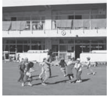
子育て環境の充実を

要望 上小学校プール前の道路(市道938号線)は、幅員が狭く、児童の通行に支障があるため、早急に拡幅してほしい。