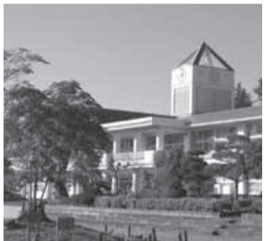
小規模特認校制度の活用を(上小学校)

要望 上小学校プール前の道路(市道938号線)は、幅員が狭く、児童の通行に支障があるため、早急に拡幅してほしい。