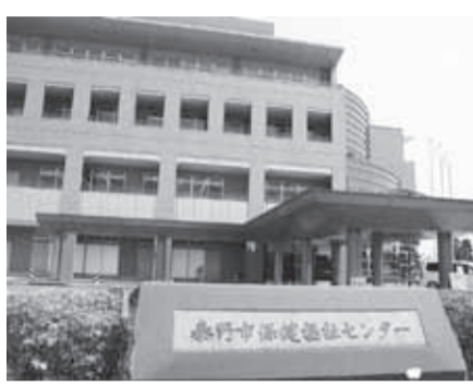
公共施設での実証実験を優先せよ

問 平成21年の勧告にある、持ち家住宅手当(月額1人当たり1万4100円、年間支給総額約7500万円)の廃止が6年間も保留になっているのは、市長が決断しないからである。原因は、市長選挙の際、秦野市職員労働組合の支持を得るために交わした、政策協定にあると考えるがどうか。