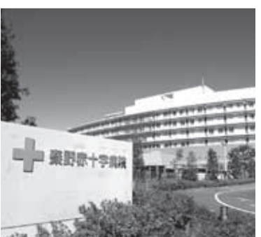
日赤の分娩再開のめどは

答 ①昭和大学から条件が出れば、日本赤十字社神奈川県支部は検討に入り、市も支援策を練る。②口頭確認だが、めどが付いていると聞いている。実現に向け努力する。 二 関東・東北水害について 問 平成27年の台風18号で1万8000棟が浸水などの被害に見舞われたが、本市の①行政の避難指示は、②廃棄物の仮置き場の確保は、③高齢者、障がい者への対応は、④鶴巻温泉駅東側線路沿いの豪雨対策工事の遅れは、どうか。 答 ①氾濫が予測された段階で避難指示に切り替える。②現在、6・8ヘクタールを確保。③要支援者は、施設へ緊急入所するなど、適切な対応ができる避難支援体制の充実を努める。④7カ月程度延びるが、1日も早い完成を目指す。 三 川崎市内有料老人ホームでの事件について 問 ①川崎市では3人が転落死亡したが、本市の介護施設などでの事故と虐待は、②健康寿命を延ばすパークゴルフ場の設置は、どうか。 答 ①介護事業全体の過去5年間で事故1269件、虐待3件。②カルチャーパーク内の入門的コースは可能。本格的コースは中日本高速道路株式会社と交渉を進める。