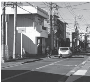
市道816号線の歩道改善を

の学びと人間的自立を優先させ、公的支援をしてほしい。 二 環境施策等について 問 本市の有害鳥獣による農作物への被害状況はどうか。 答 平成14年度から26年度までの調査によると、年々減少している。 問 ごみ分別収集の市民への周知はどのように図られているか。 答 自治会長や廃棄物減量推進員を対象に、毎年説明会を実施するほか、出前講座も行っている。 問 ごみ処理基本計画にある目標値より実績が下回っているが、今後どのように取り組んでいくのか。 答 一層の分別・資源化を図り、ごみはすべて資源だという考え方で取り組んでいきたい。 三 土木施策等について 問 市道816号線歩道の段差と傾斜の改善は進んでいるのか。 答 今後も地権者などの協力が得られるよう努力し、歩きやすい歩道整備に努めていきたい。