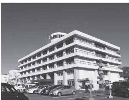
多様化する市民ニーズに対応した職員の育成を

二 常勤一般職員と特定職員・臨時的任用職員のあり方について 問 多様化・高度化する市民ニ