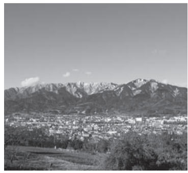
観光資源を活用して観光客誘客を