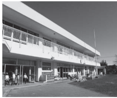
保育園・幼稚園の早期療育推進事業の課題は

問 障害者差別解消法は、平成25年6月26日に公布され、28年4月1日に施行されるが、既に施行されている障害者虐待防止法の取り組みと虐待の件数はどうか。 答 現在、市町村虐待防止センターの設置、虐待防止の広報・啓発関係部署との連携体制の整備を行っている。また、虐待の通報および届出の件数は、25年度は12件(1件が認定)、26年度は11件(4