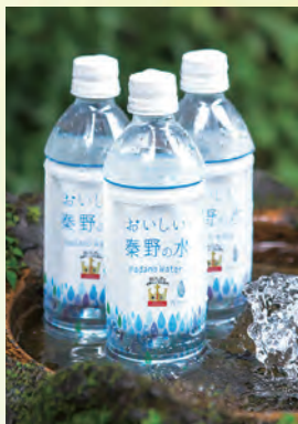
全国1位に輝いた「おいしい秦野の水」