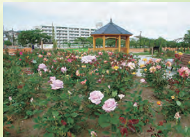
バラ園からミライエを望む