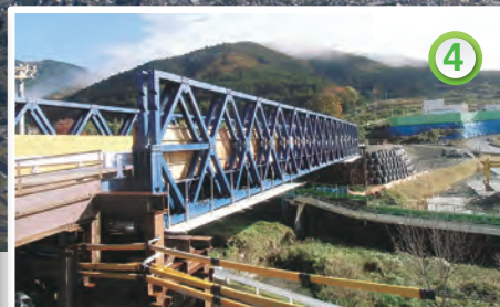
葛葉川を跨ぐ仮橋