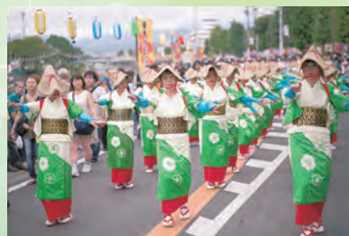
華やかな千人パレード