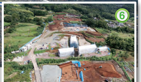
上空から工事を望む