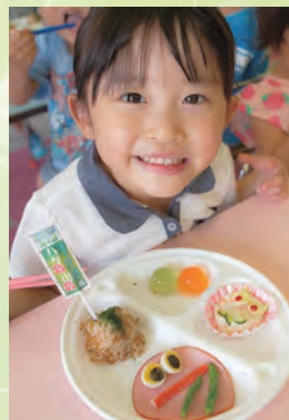
山の日を記念した給食を前に笑顔