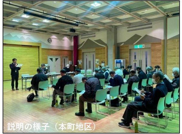
説明の様子（本町地区）

今後も速やかな事業進捗を図っていくため、定期的な説明や情報発信の継続に努めてまいります。