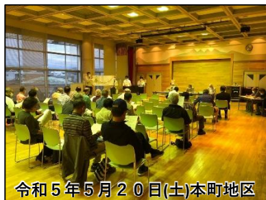
令和5年5月20日(土)本町地区