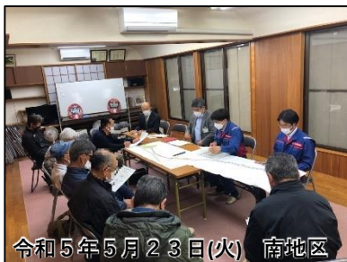
令和5年5月23日(火)南地区