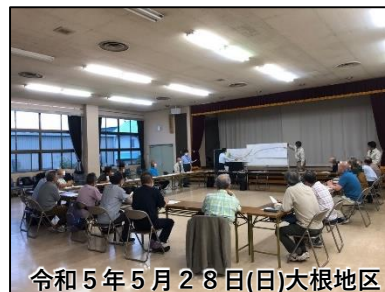
令和5年5月28日(日)大根地区