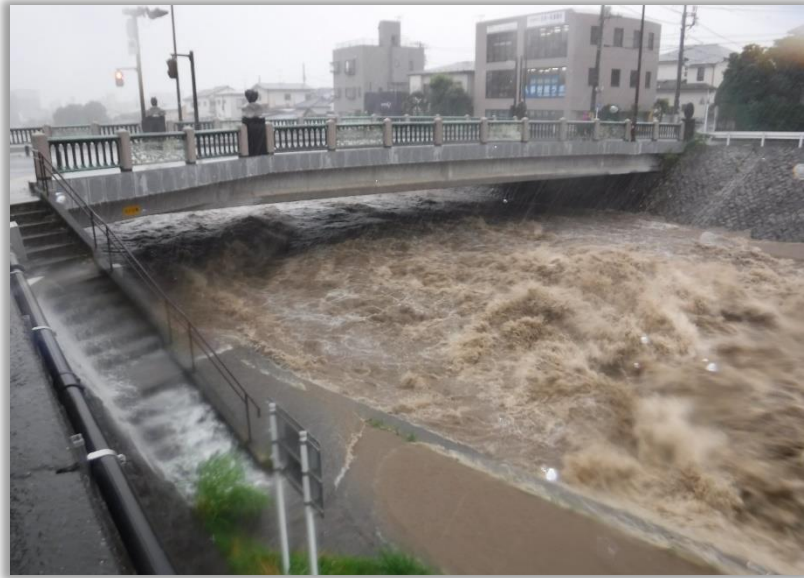
(R3.7.3_本庁舎前桜橋(水無川)のようす)