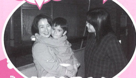
支援会員さんをお見送り