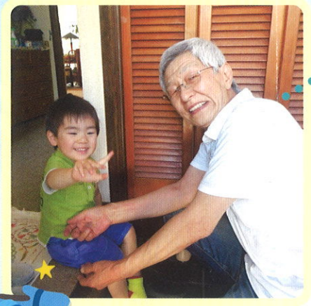
さあ、 保育園へ行くよ