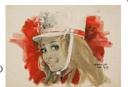
『Invitation to screen and popular music』

大人から子どもまで、多くの人々の目に留まる数々のレコードジャケット。ポップキュートな女性が魅力的です。