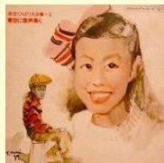
美空ひばり大全集1 『青空に歌声高し』レコードジャケット 1967

本展では、戦後の歌謡界を代表する美空ひばりの「美空ひばり大全集」を7枚展示しています。ひばり自身の強い要望によって宮永に制作依頼されました。