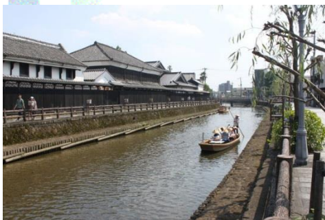
巴波川沿いの蔵造りの街並み

※上記行程は、令和元年9月1日現在であり、天候、交通機関、その他の理由により変更となることがありますので予めご了承ください。