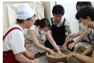
名水で仕込むそば打ち体験

ホームページ http://www.odakyu-travel.co.jp 電話03(3379)6199