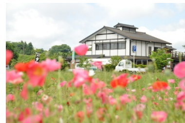
そば打ち会場 田原ふるさと公園

ホームページ http://www.odakyu-travel.co.jp 電話03(3379)6199