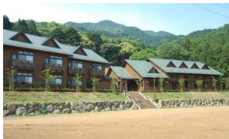
表丹沢野外活動センター