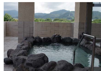
名水はだの富士見の湯