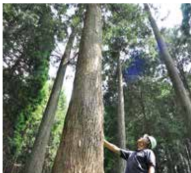
国を代表するレガシーに秦野産材の活用を

問 建物の予防保全として、建築基準法第12条に基づく点検義務があるが、本市の公共施設は一部を除き、平成24年度から点検が行われず違法状態が続いており、図面などの文書管理も適切でない。