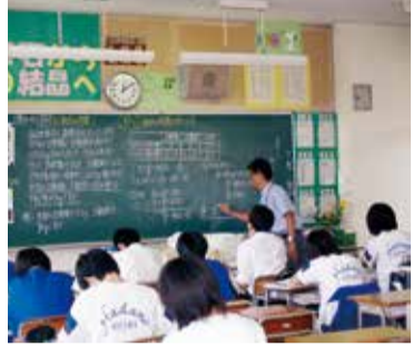
多忙な教職員の支援を(写真は中学校の授業の様子)

答 個人メールアドレスの付与については、外部協力者などへの連絡や業務の効率化につながる一方、経費やセキュリティ上の課題がある。学校に付与されている1つのメールアドレスを全教職員がグループで共有し利用する形態など、