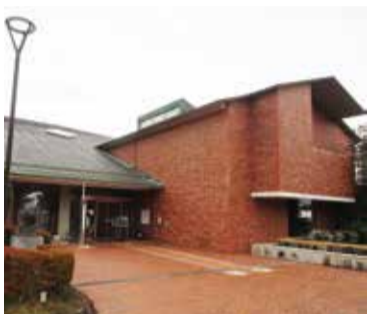
図書館基本計画の見直しを(写真は市立図書館)

また、目標値の根拠が不明確であり、結果の検証ができない。全面的に見直すべきと思うがどうか。