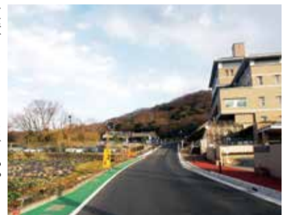
はだのクリーンセンターに隣接した加茂川地区の整備を

問 地元との意見交換会で公園整備などに関する意見があるが、都市計画公園の位置付けをする上で