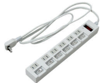
(一括スイッチ付き節電タップ)