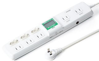
(ワットメーター付き節電タップ)