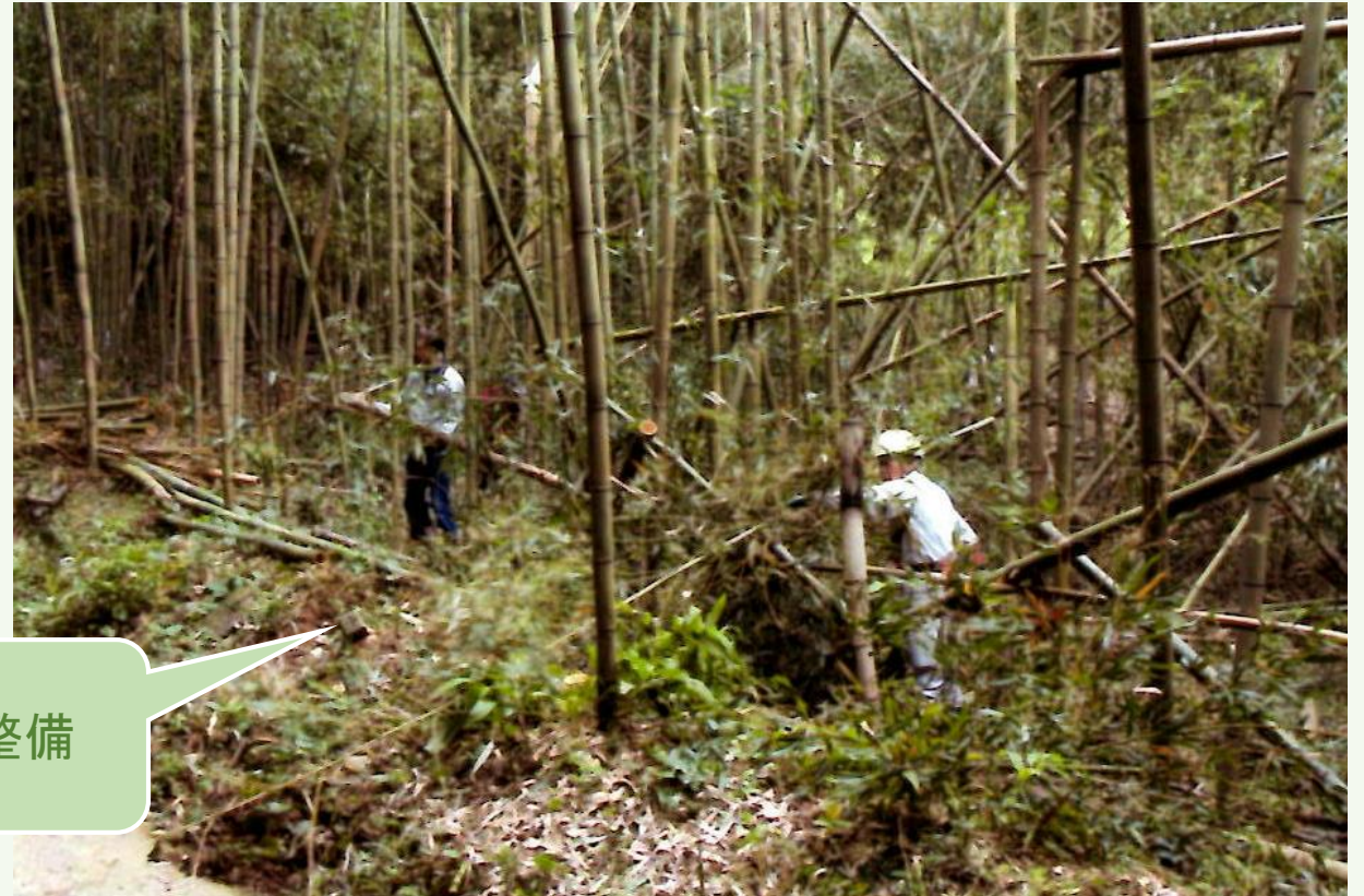
地元有志による竹林整備