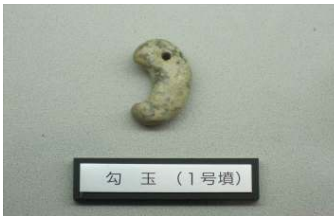
展示されている1号墳から出土したまが玉

昔の人の装身具である”まが玉作り”を通して小学生やその保護者の方々に歴史に対する興味 関心をもっていただくことを目的としています。丁寧に指導しますので初めての方でも完成させることができます。