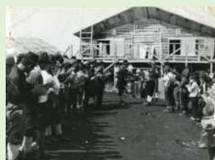
尊仏山荘 丹沢写真コンクール 昭和48年頃