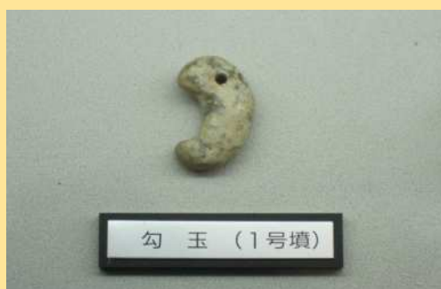
展示されている桜土手1号墳から出土したまが玉