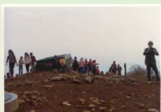
日ノ出山荘岩田傳三郎氏撮影 昭和57年頃