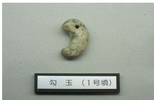
展示されている1号墳から出土したまが玉