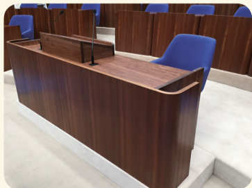
秦野産材を用いた質問者席