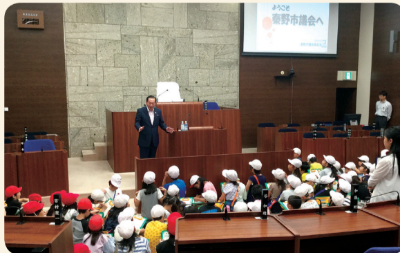
議長の説明を聞く児童の様子

市議会では、子どもから大人まで、多くの市民に議会を知り、関心を持っていただくため、議場の見学を受け付けています。詳しくは市議会ホームページをご覧ください。