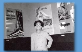
自身のポスター作品の前で

宮永は戦後日本の商業デザイン界を牽引するデ ザイナーの一人でした。特にポスターは評価が高 く、1950年代はアムステルダムステデリックミュ ージアム主催世界ポスター展、チューリッヒ・ポ スター美術巨匠展に招待出 品、1960年にはアラブ連合 主催世界観光ポスター展 最優秀賞を受賞するなど、その 活躍は海外にまで及びまし た。