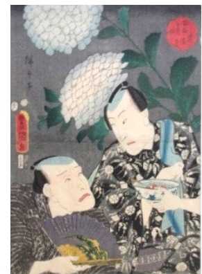
歌川国貞（三代豊国）・歌川広重