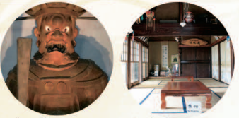
大日堂 エリア▶P13 緑水庵 エリア▶P13