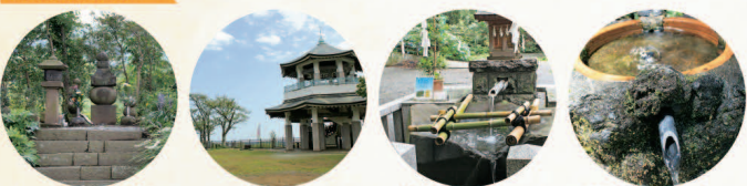
源実朝公御首塚 エリア▶P15 弘法山公園 エリア▶P16 井之明神水 (曾屋神社) エリア▶P17 護摩屋敷の水 MAP D-2