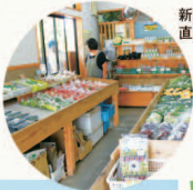
新鮮な農産物の直売所

▲秦野市東田原999 ②0463-84-1281 ③25台(無料) ④9:00~17:00 ⑤月曜(祝日の場合は翌日)、年末年始(12/30~1/4)