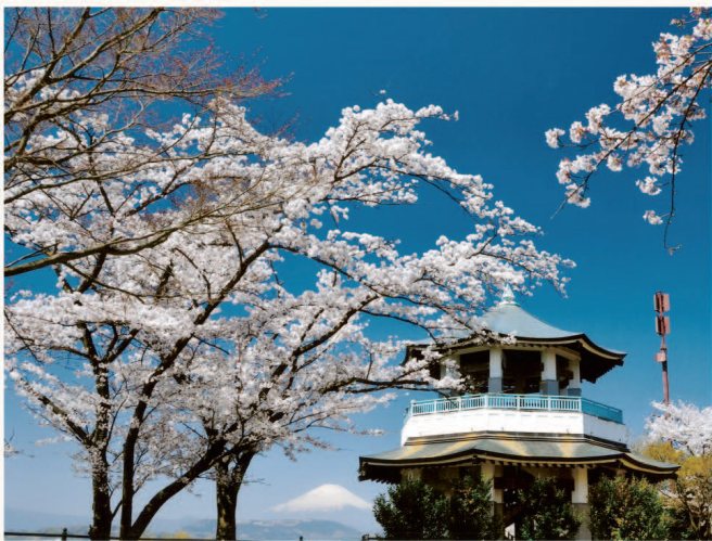
弘法山公園・権現山山頂展望台