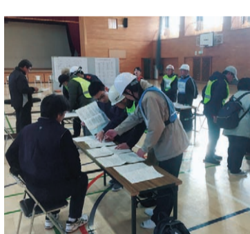
避難所運営訓練の様子