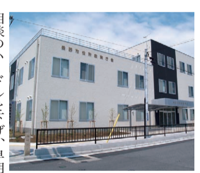
SNSを使ったいじめ相談を(写真は、市役所教育庁舎)