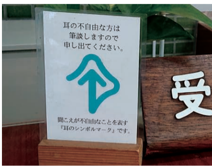
聴覚障害への支援を

三 廃プラスチックの課題について 問 国際的に課題となっている廃プラスチックの処理はどのようか。収集回数を増加してはどうか。 答 公益財団法人日本容器包装リサイクル協会を通じて国内の再商品化事業者へ引き渡し、適正処理している。なるべく燃やさず、減量・資源化を図りたい。収集日を増やすと委託料が増加するため、容器包装プラスチックを含め資源物をいつでも持ち込めるよう、ストックハウスを増設予定である。