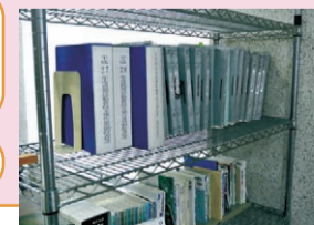
本庁舎4階の議会情報閲覧コーナー