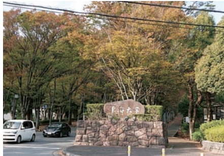
東海大学における若い力を十分に生かした連携の強化を

答 中・長期的なまちづくりや幼児保育・教育の充実などの分野で連携をさらに強固にしていこう。