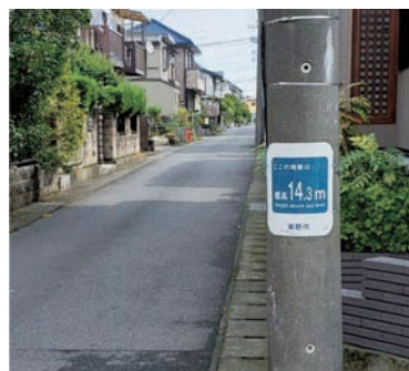
電柱への表示で日頃からの注意喚起を

答 令和2年度のグランドオープンに向けたプロモーションの際に、本市の地域特性を生かしたプログラムを準備し、多くの人が訪れたくなるよう情報発信に努める。