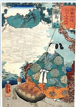
歌川国芳 木曾街道六十九次之内 福島 浦嶋太郎