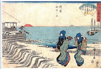
歌川広重 江戸高名会亭尽 洲崎 初日之出