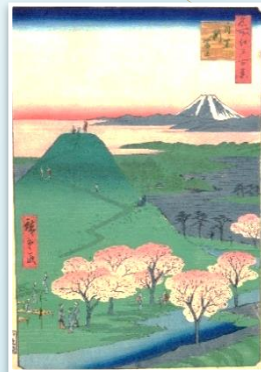
歌川広重 名所江戸百景 目黒新富士