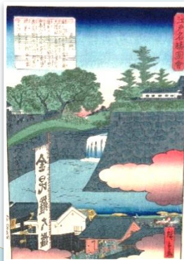
二代歌川広重 江戸名勝図会 虎の門