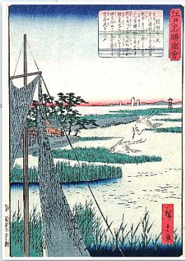
二代歌川広重 江戸名勝図会 羽田弁天