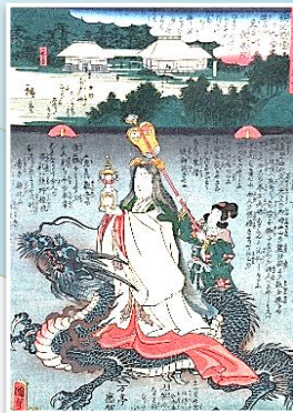
二代歌川広重・二代歌川国貞 観音霊験記 秩父順礼廿九番 笹の戸見目山長泉院 龍女