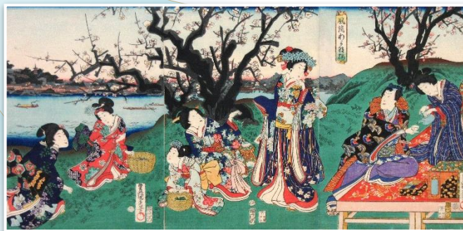
歌川国貞 (三代豊国) 風流わか摘