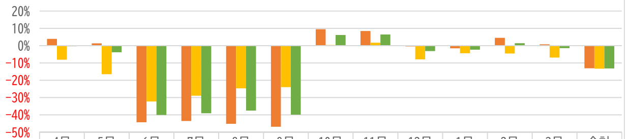
R2使用料金（対前年度）