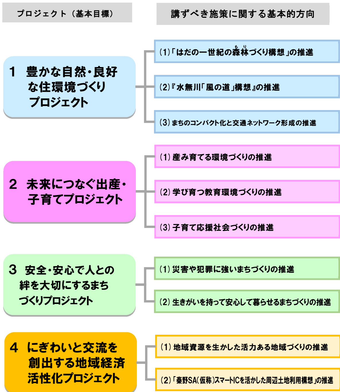
《プロジェクト（基本目標）体系図》

市総合戦略では、人口減少と地域経済縮小を克服するため、地域の特色や地域資源を生かした方策について調査・検討を重ね、プロジェクト（基本目標）を次のとおり設定しました。