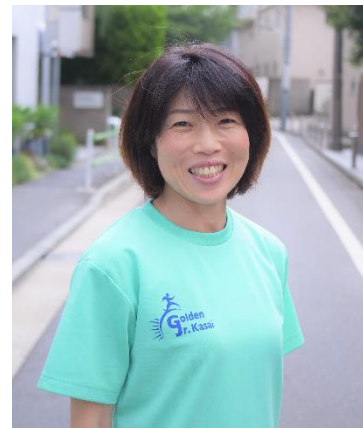
世界大会でも実績を持つ

また、参加者全員に当大会のロゴマークが入ったトートバックや缶バッチのほか、抽選で万葉の湯や湯花楽のペア無料券が当たります（各5組）。