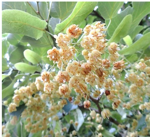
ボダイジュ シナノキ科

❀ 6月 中部地方以西に分布 タネは羽根つきの羽根やじゅずの材料。お寺に植栽されます。果肉を水に入れて振ると石けんのよう泡立ちます。