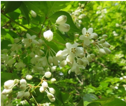
ミツバウツギ (植栽)

ウツギとは空木と書きます。幹の中が空洞になることからこの名があります。バラ科、アジサイ科、スイカズラ科、ミツバウツギ科など複数の科の植物にウツギという名が付けられています。