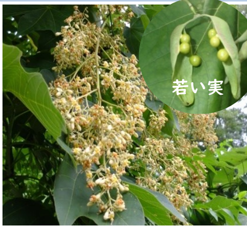
アオギリ アオイ科

❀ 7月 中国南部・東南アジア原産 名は葉がキリに似て幹が緑色であるため。水分が多く耐火性があります。