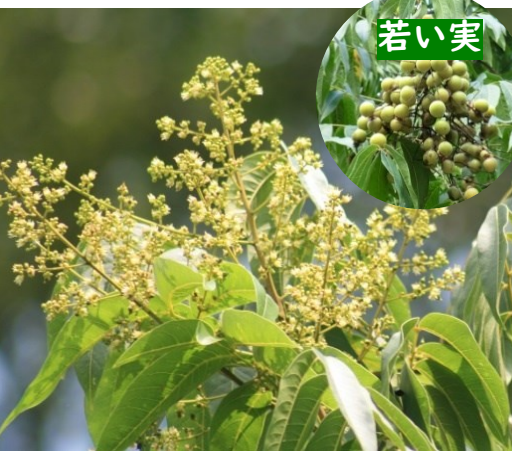
ムクロジ ムクロジ科

❀ 6月 中部地方以西に分布 タネは羽根つきの羽根やじゅずの材料。お寺に植栽されます。果肉を水に入れて振ると石けんのよう泡立ちます。