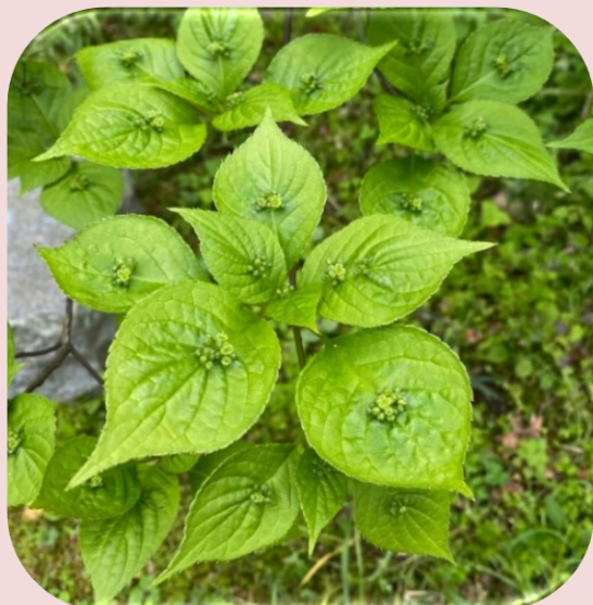
どんぐり山の雄木(4月)