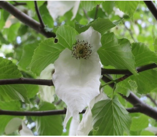
ハンカチノキ ミズキ科