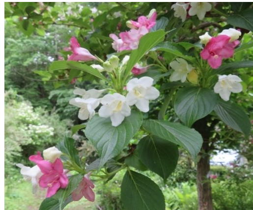
ハコネウツギ (植栽)