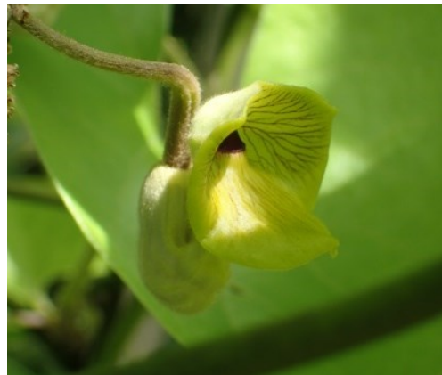
オオバウマノスズクサ

野山の秋の味覚の代表。甘い果実が有名ですが、薄紫色の花も美しいです。雄花と雌花があります。