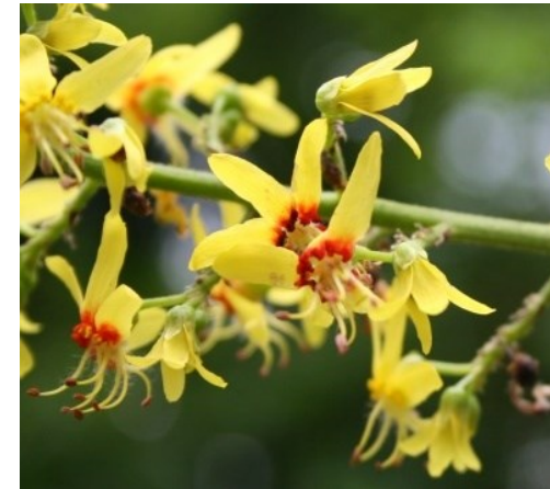
モクゲンジ ムクロジ科

❀ 6月 中国原産 花には芳香があります。お釈迦様がその下で悟りを開いたというインドボダイジュとは別種。