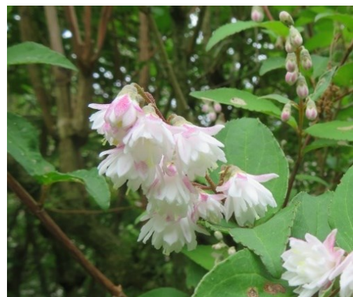
サラサウツギ (植栽)