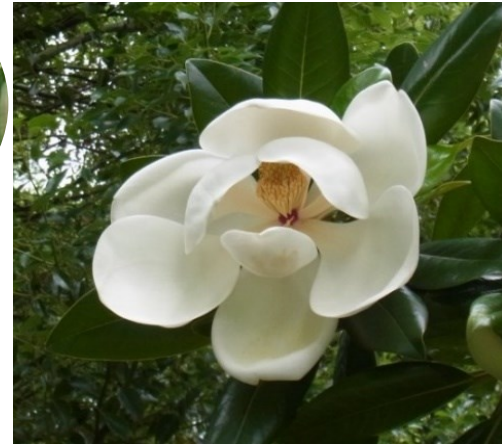
タイサンボク モクレン科

❀ 7月 中国南部・東南アジア原産 名は葉がキリに似て幹が緑色であるため。水分が多く耐火性があります。