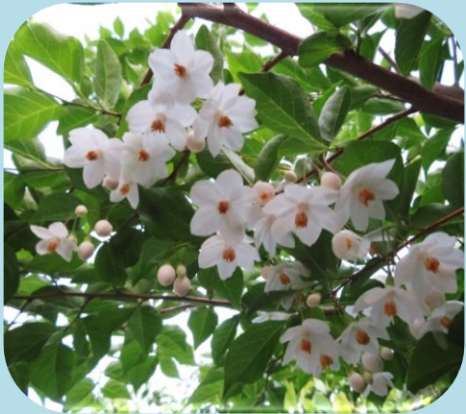
エゴノキの花 ❀ 5月