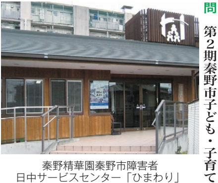
秦野精華園秦野市障害者日中サービスセンター「ひまわり」

総務分科会 政策部・総務部 くらし安心部・文化スポーツ部 会計課・議会局 監査事務局・消防本部 選挙管理委員会事務局