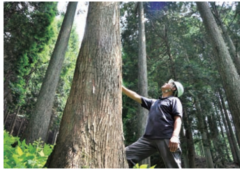
環境問題に対し先進的な取り組みを