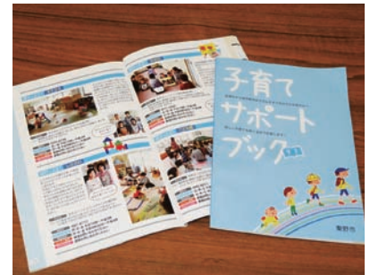
市民のライフスタイルに合わせた 育児環境の整備を