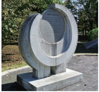
市民と共に平和への願いを (写真は、平和都市宣言の碑)

答 国政の場で判断するため、市長として発言する立場にないと考えるが、平和都市宣言を制定して