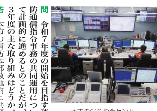
本市の消防指令センター

企画事務費について 問 大学生の知見を活用して行政課題を解決するための取り組みを進めている自治体もある。本市においても大学と連携し、若者の声をまちづくりを生かすための仕組みが必要と考えるが、どうか。 答 大学提携を進める中で、本市の課題と大学の研究機能とのマッ