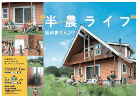
今こそ移住・定住に後押しを (写真は、埼玉県飯能市「半農ライフ」)

二 支援教育について 問 令和3年度における特別支援学級の在籍者は20年前の5倍以上となる524人を予定するなど増加傾向であるが、通常学級にも支援を必要とする子どもがいる。本市の対応はどうか。