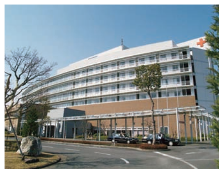
病院の強みについて積極的な情報発信を

問 認知症を患う人の尊厳が守られることが重要であり、当事者の立場に立つユマニチュードやタクティールといった介護技法の研修を取り入れてほしい。