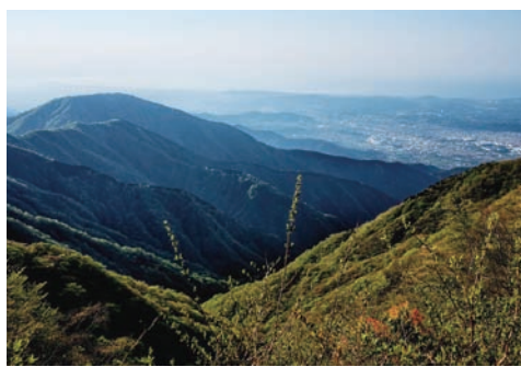
森林観光都市としてのイメージアップを