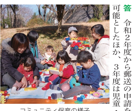
コミュニティ保育の様子

総務分科会 政策部・総務部 くらし安心部・文化スポーツ部 会計課・議会局 監査事務局・消防本部 選挙管理委員会事務局