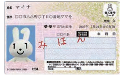
ICT化の推進に向け マイナンバーカードの普及促進を

答 小児科の常勤医師が2人増員されることにより、入院診療が再開される見通しとなった。周産期医療に必要な小児科が拡充されたことは、分娩業務再開に向けて一歩前進したと受け止めている。妊産婦への支援については、健康診