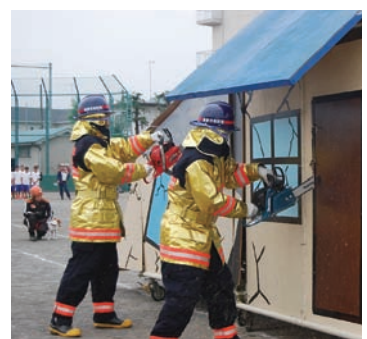
訓練を行う消防団員

問 消防団員の報酬を一律6千円引き上げるとは評価するが、災害時の出勤手当の引き上げ額を100円とした理由はどのようなか。 答 令和2年12月の国からの通知において、特に地震・風水害に係る出勤手当の引き上げについて助言があり、他市とのバランスや過去の経過などを参考としたものである。