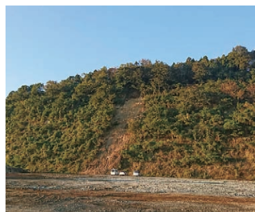
時期を捉えた最善の土地活用を(写真は、羽根スポーツ広場(仮称)用地)