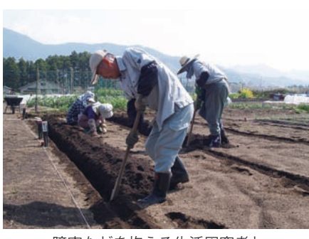
障害などを抱える生活困窮者と農業者をつなぐ支援を