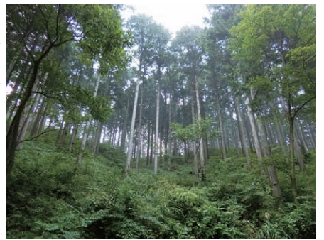
さらなる森林の育成・活用を

地球温暖化対策事業費について 問 本事業は当初、約1700万円をかけた小水力発電施設の整備を行う予定であったが見送られている。令和3年度のゼロカーボンシティ実現への取り組みはどのようか。 答 3年度には(仮称)地球温暖化対策実行計画の策定を予定して