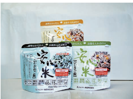
生活に困っている人へ備蓄食糧の有効活用を

答 ①死者20人、避難者5090人を想定する。耐震改修工事の補助や感染症を踏まえた避難所環境の向上に努める。②ライオンズクラブなどの支援を受け、薬物乱用防止教室を開催するなど指導する。