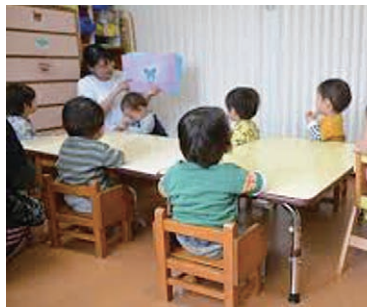
幼児教育・保育無償化から1年6ヵ月、量から質が求められる保育