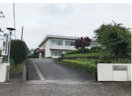
移転が検討されている平塚保健福祉事務所秦野センター