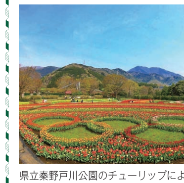
県立秦野戸川公園のチューリップによる五輪

総務分科会 政策部・総務部 くらし安心部・文化スポーツ部 会計課・議会局 監査事務局・消防本部 選挙管理委員会事務局