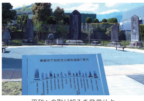
平和への取り組みを発信せよ (写真は、秦野市平和祈念公園)