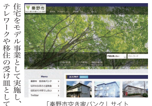
「秦野市空き家バンク」サイト

取り組んでほしい。 名水はだの富士見の湯管理運営費について 問 給排水管の不具合を改修するための費用として、約6千万円を計上しているが、建設当初の工費は約2500万円であった。2倍以上の費用を計上する理由はどのようか。 答 埋設された給排水管を撤去し、高温に耐えられる設備とするための工事を限られたスペースの中で行うことから、当初の工事費に比べ高額となっている。 空家等対策事業費について 問 令和2年度を最終年度とする空家等対策計画に基づき、292軒の管理不全空家のうち25軒が解体されるなど、これまでに182軒が改善されたことだが、3年度における取り組みはどうか。 答 新たに制定する空家等の適正管理に関する条例に基づき、管理不全空家の解消に取り組むとともに、空き家を活用した移住お試し