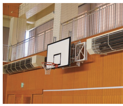
計画的な環境整備が望まれる学校体育館