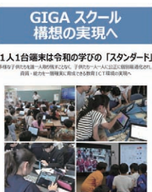
GIGAスクール構想リーフレット