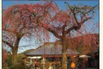
② 白泉寺しだれ桜 樹齢120年ともいわれ、4月上旬の花の時期には多くの見物客が訪れます。