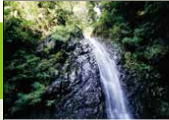
④ 黒竜の滝 滝の近くに「黒竜さん」という折禰師の庵があったことからついた名ともいわれます。