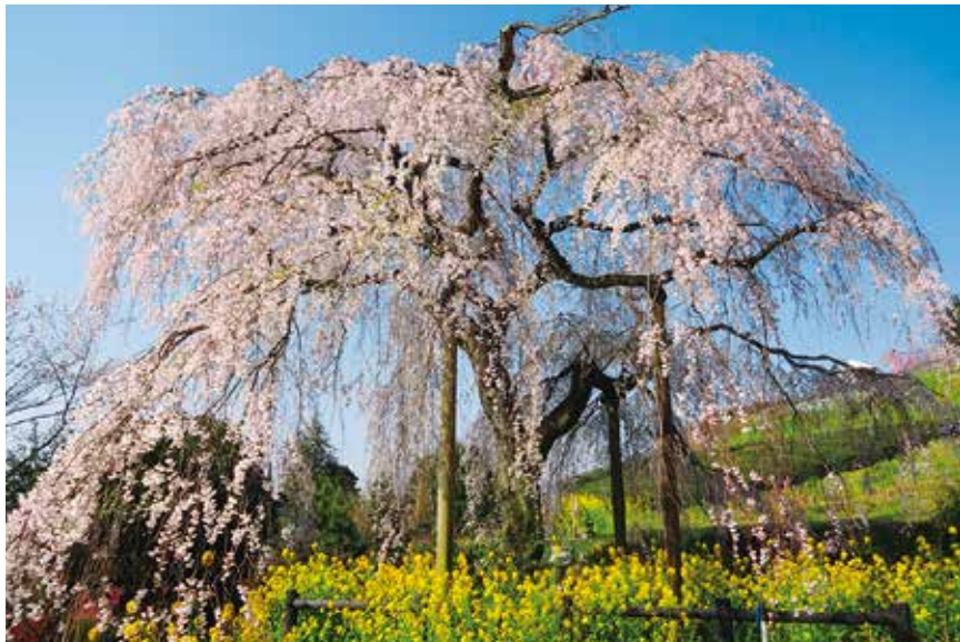
「寄五大しだれ桜」のひとつ(土佐原のしだれ桜)

歩いて、未病を改善! 秦野市 松田町 No. 75 神奈川県・県西地域ウォーキング