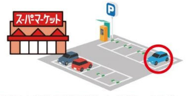
駐車場・駐輪場は建物から遠い場所へ