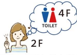
別のフロアのトイレに行く