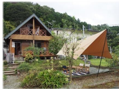
自然に囲まれた生活を体験