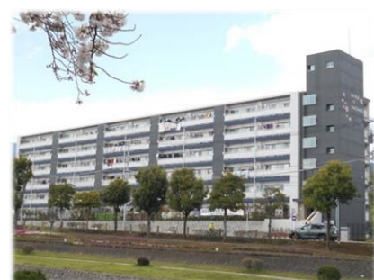
若者・子育て夫婦が対象