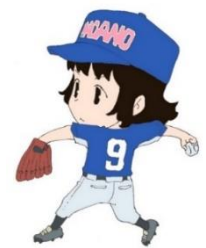
女子野球 イメージキャラクター

市内在住のイラストレーターである鬼頭莫宏さん作成の女子野球イメージキャラクターを使用したチラシやポスターにより、女子野球の普及啓発を図ります。