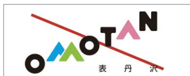
文字の並べ方の変更