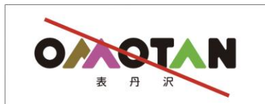
規定以外の色の組合せ