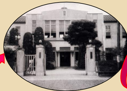
【明治時代】(秦野葉煙草専売所)