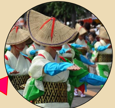
【現在】(秦野たばこ祭)