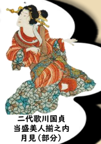
三代歌川国貞 当盛美人揃之内 月見(部分)