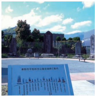
秦野市平和祈念公園

施政方針にある「誰もが住んでみたい・住み続けたい元氣溢れるふるさと秦野」をつくるため、どのように取り組んでいくのか。また、コロナ禍で市民の暮らしと経済を立て直すには、市民負担を