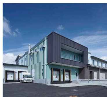
給食センターの建設費は約18億円