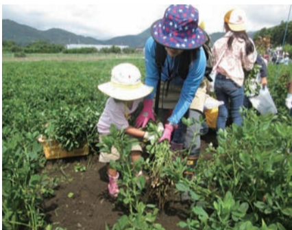
落花生の振興を(掘り取り農園)

落花生栽培の基本は土づくりであり、有機質肥料により根粒菌を増やすことが重要だが、栽培に関する指導はどのようなか。農業協同組合主催の栽培講習会を毎年開催するとともに、作付け前に農協が出荷者を対象に実施する土壌診断の結果を基にした土壌改良が行われている。市としては、落花生生産支援事業補助金制度を設け、生産振興に努めている。