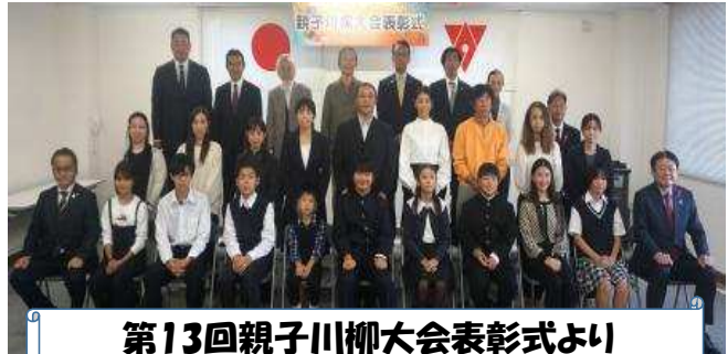
第13回親子川柳大会表彰式より